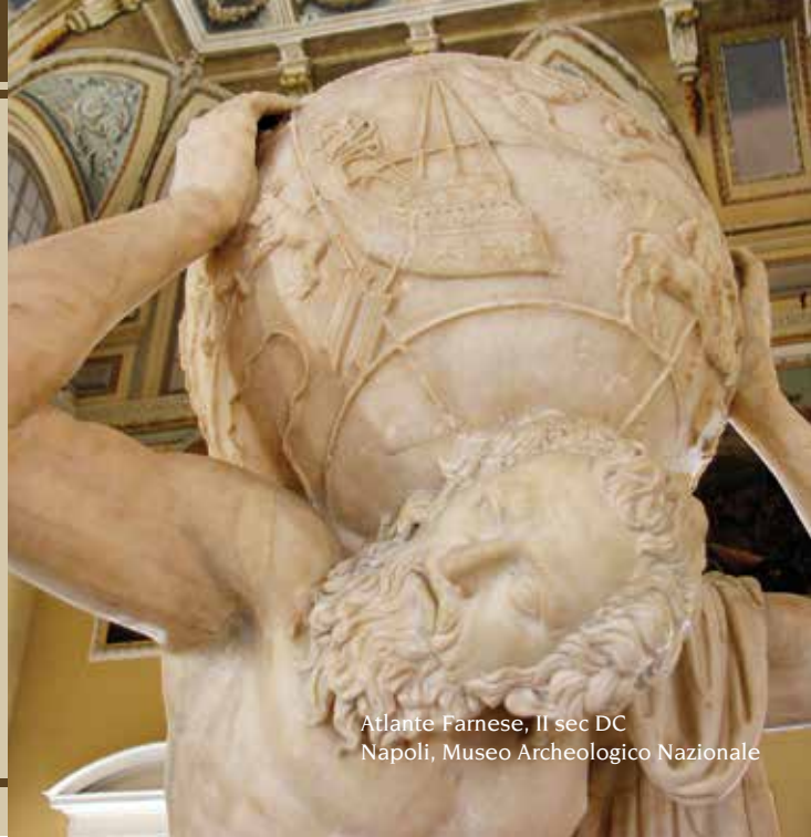
Atlante Farnese, II sec DC Napoli, Museo Archeologico Nazionale